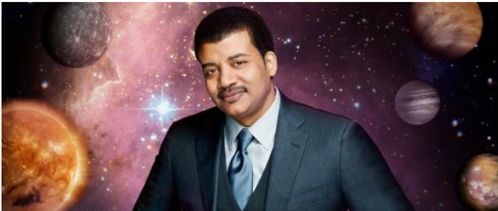
Neil deGrasse Tyson

‘A menudo, quienes no saben estadística se sienten obligados a explicar lo que simplemente son fluctuaciones naturales en los datos’.