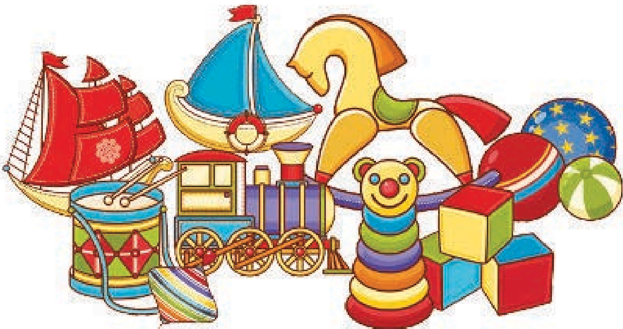
Ilustración: © Zoia Nikolskaia / Shutterstock.com