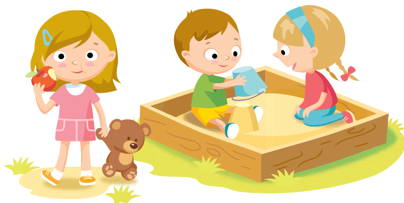
Ilustración: © Olga1818 / Shutterstock.com

Al terminar de leer el texto, identifica las palabras que no conozcas y búscalas en el diccionario para que hagas un glosario, después responde las siguientes preguntas: ¿qué es un ambiente enriquecido?, ¿qué características tienen los materiales de los ambientes enriquecidos?, ¿cómo los adultos podemos generarlos?